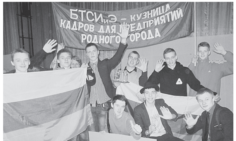
Команда «Механики» победила в конкурсе презентаций профессий