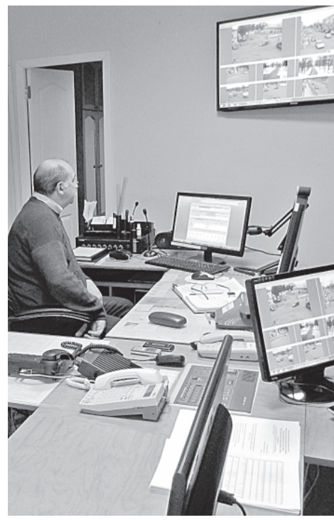
Оперативный дежурный за работой

КОЛЬЦО С САПФИРОМ И КУПОН ПОДАРЯТ ШАНС НА МИЛЛИОН!