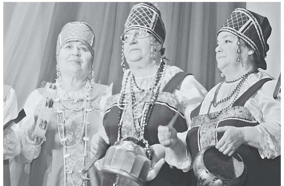
«Среди нас есть артисты, тетицы, пародисты, вязать мастерицы, и все мы — певицы».