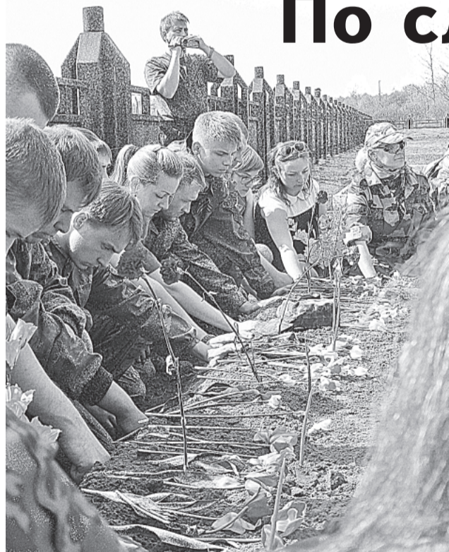
В Мясном Бору. Весна 2016 года

Боровичский поисковый отряд «Звезда» установил имена четырёх бойцов 2-й Ударной Армии, обнаруженных в районе д. Мясной Бор во время весенней и осенней «Вахт Памяти».