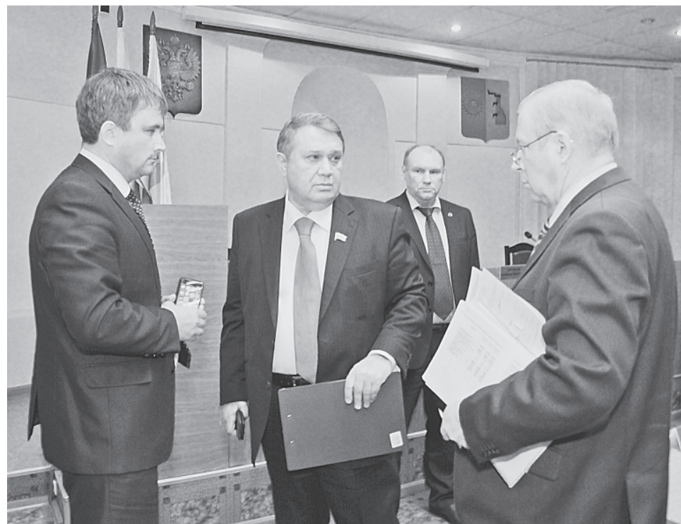
Очередное заседание Думы района проходило в необычном формате – с присутствием депутата Госдумы Александра Коровникова