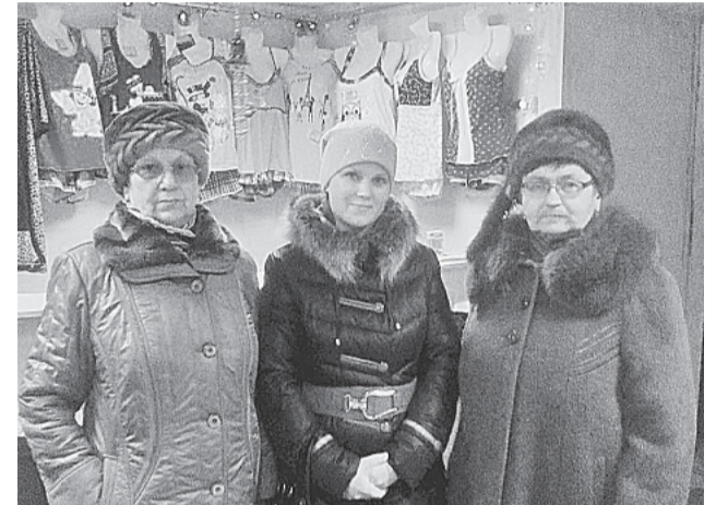
Победители новогоднего розыгрыша в магазине «Людмила», 2015 год

Наш адрес: ул. Коммунарная, 21, (напротив городской стоматологии), тел. 8-963-369-68-68.